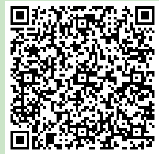
QR Code เอกสารการเรียนการสอน